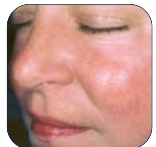
3 Monate nach 3 IPL-Behandlungen Robert A. Weiss, MD Hunt Valley, MD (USA)