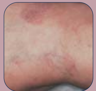
3 semaines après 1 traitement laser Neil Sadick, MD, FACP New York, New York (États-Unis)