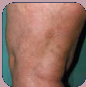
3 semaines après 3 traitements IPL et 1 traitement laser Mark Troxler, MD Arlenheim, Suisse