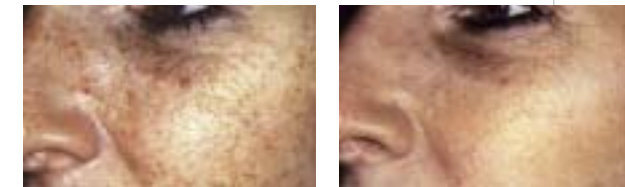
Durch Lichteinwirkung gealterte Haut ("Photo-Aging") — Nach 4 IPL-Behandlungen

Viele Menschen leiden unter erweiterten Blutgefäßen, was zu einem roten Gesicht bzw. einer chronischen Errötung führt und den Betroffenen oft peinlich ist. Die IPL-Technik kann diese erweiterten Blutgefäße und die Gesichtsröte bei Frauen und Männern erfolgreich behandeln, ohne die umgebende gesunde Haut zu verletzen.