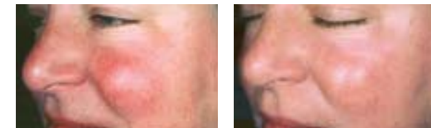
Erweiterte Äderchen — Nach 2 IPL-Behandlungen